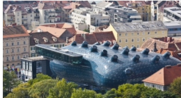
O.: Kunsthaus Graz, 2003 Schloßbergblick/View from the Schloßberg; Architekten/ Architects: Peter Cook and Colin Fournier